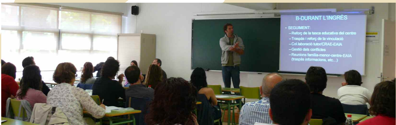
Grup de treball: Els EAIA, un mecanisme d'intervenció global