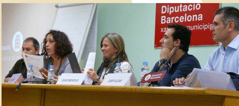
Taula rodona: Models de treball amb infància i família