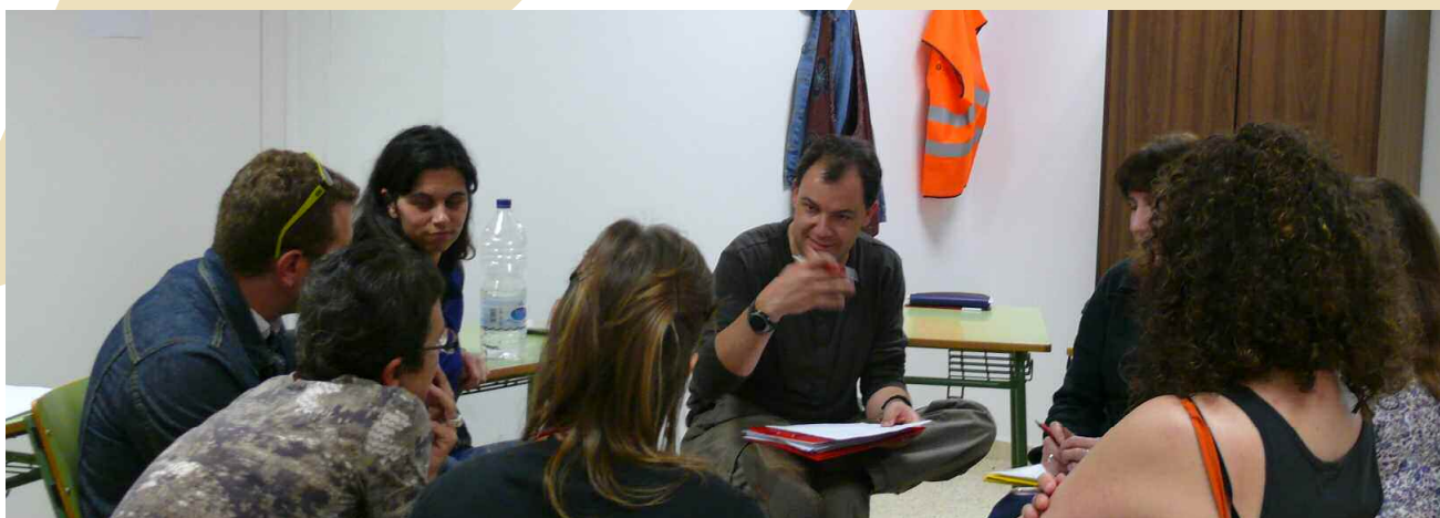
Grup de treball: Treball amb famílies a partir dels Serveis Residencials (CRAE, etc.)