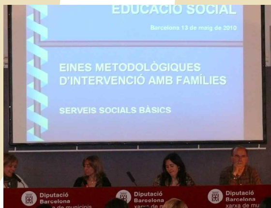
Grup de treball: Serveis Socials Bàsics i treball amb famílies