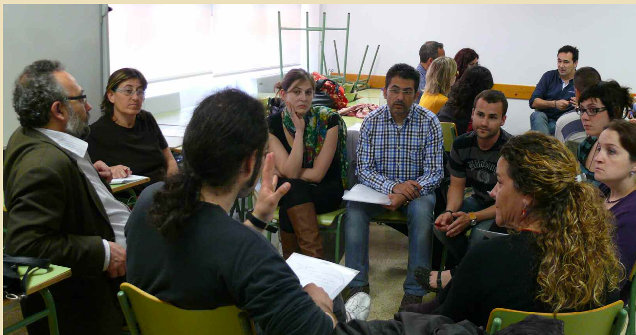
Grup de treball: Treball amb famílies a partir dels Serveis Residencials (CRAE, etc.)